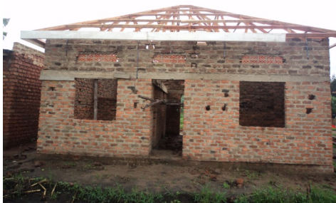
Die Klinik im Mai 2011

Dieses Projekt errichtet eine Klinik in Katerera, Bushenyi , West-Uganda, einer Gegend, in der es keine oder nur eine extrem unzureichende medizinische Versorgung gibt. Außerdem gibt es einen dringenden Bedarf an Aufklärung. Die Klinik ist so ausgerichtet, dass sie in der Lage ist durch die Patienten, die sich eine Behandlung leisten können, die eigenen Kosten zu decken und zusätzlich all jene kostenfrei behandeln kann, die sich keine Behandlung leisten können.